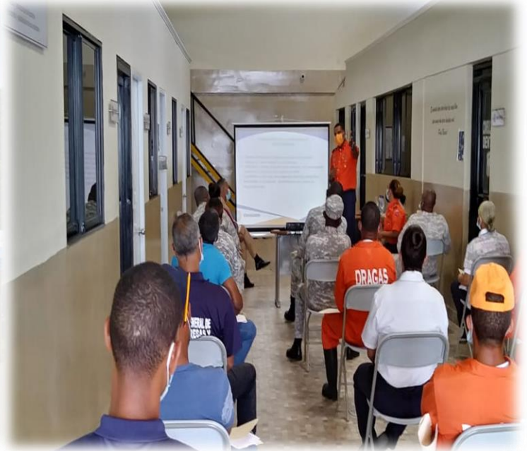
Curso Taller Control y Extinción de Incendios