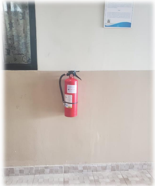
Colocación de extintores