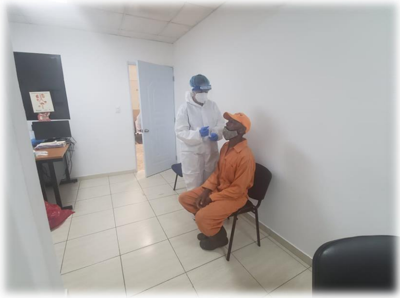
Operativo Médico de Pruebas PCR