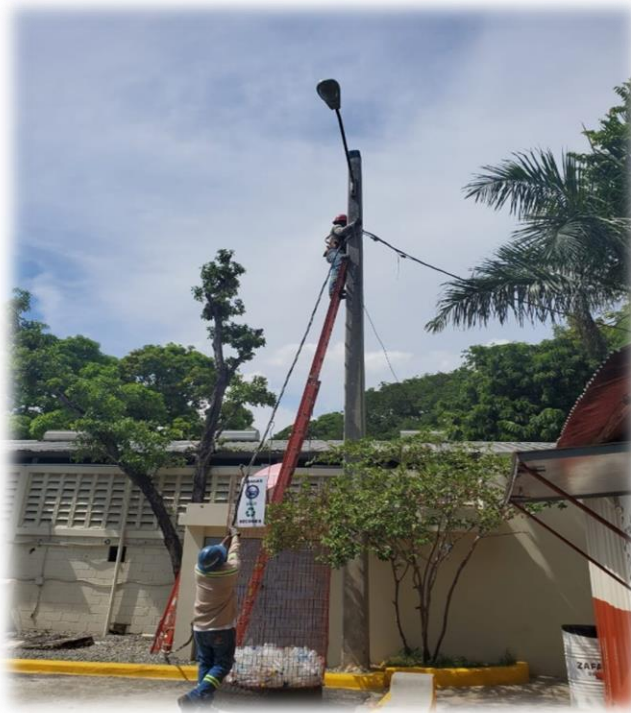
Reubicación cable de alta tensión