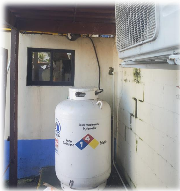
Señalización del tanque de GLP con el rombo de diamante NFPA 704