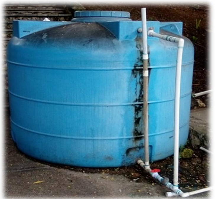
Trabajos de plomería