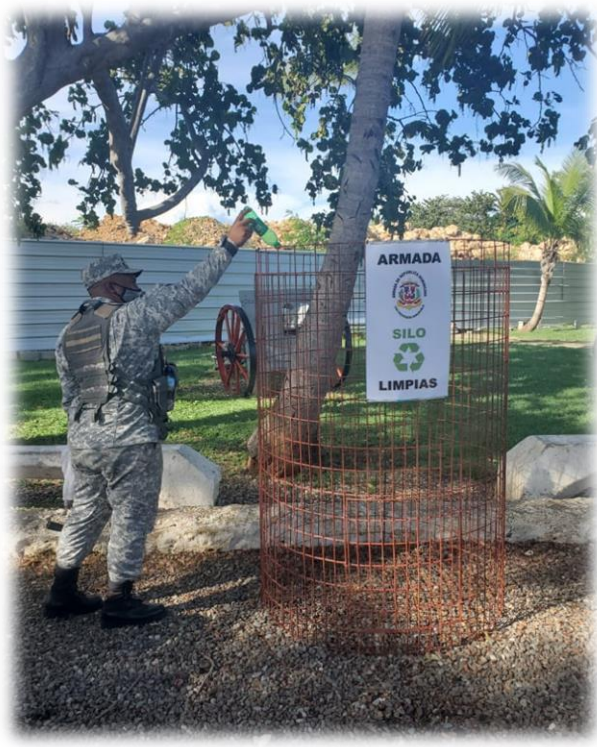
Donación de Silos para reciclaje de desechos plásticos