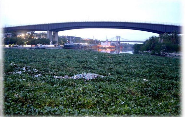
Limpieza del Río Ozama luego del paso de la tormenta tropical Laura.