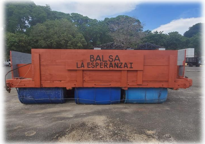
Construcción de Balsa “La Esperanza I”