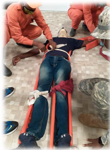
Curso Taller de Primeros Auxilios