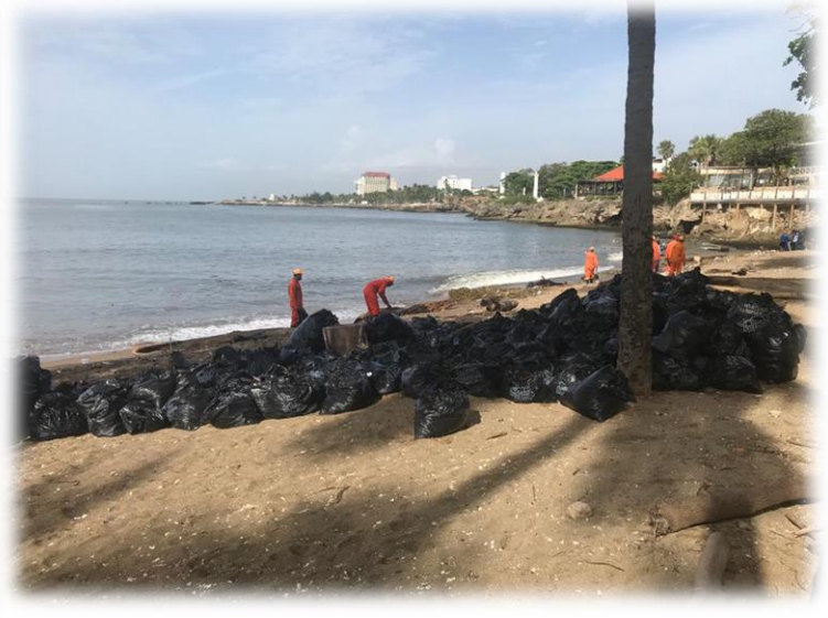
Limpieza de Montesinos en apoyo al Ayuntamiento del Distrito Nacional