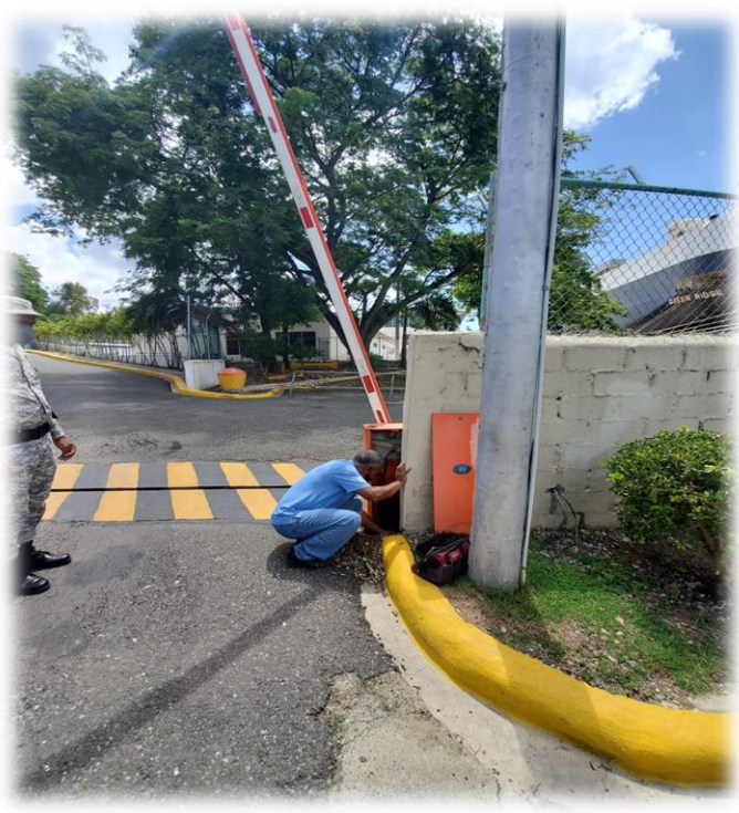
Reparación barra mecánica