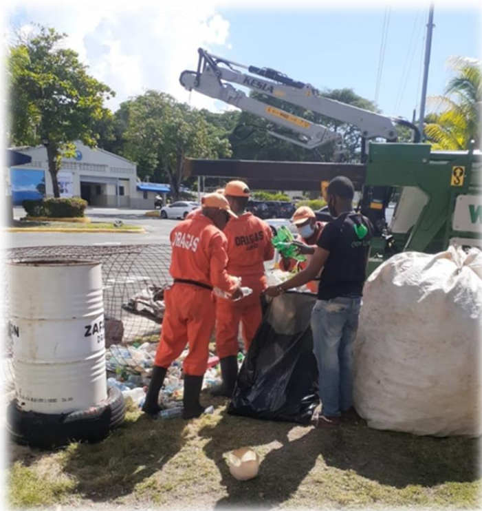
Clasificación de los Desechos Plásticos