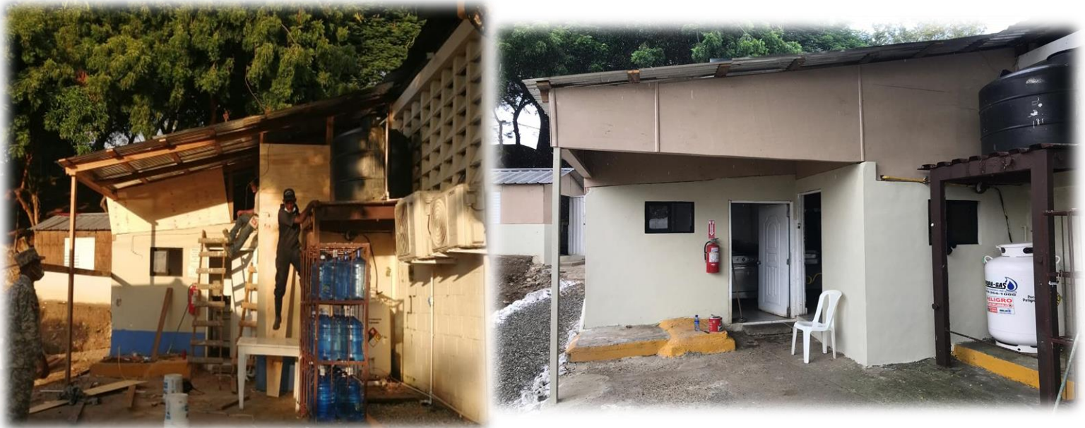
Remodelación de la cocina