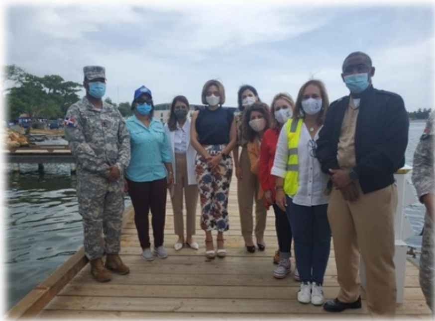
Visita del Voluntariado del Banco de Reservas