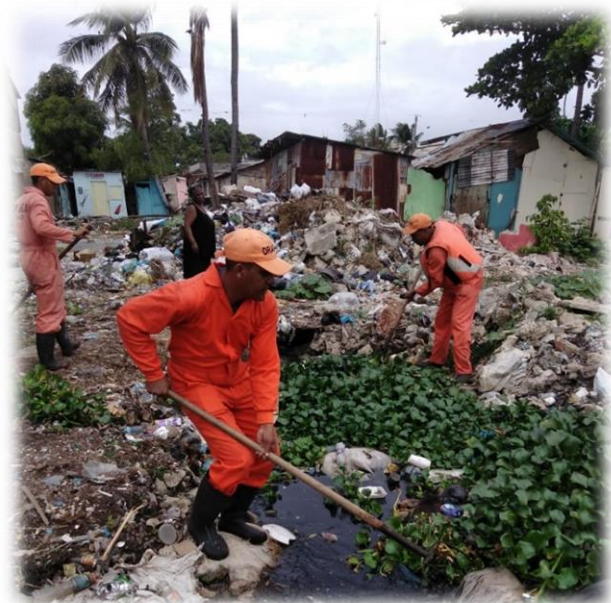
Operativo de limpieza de los ríos Ozama e Isabela.