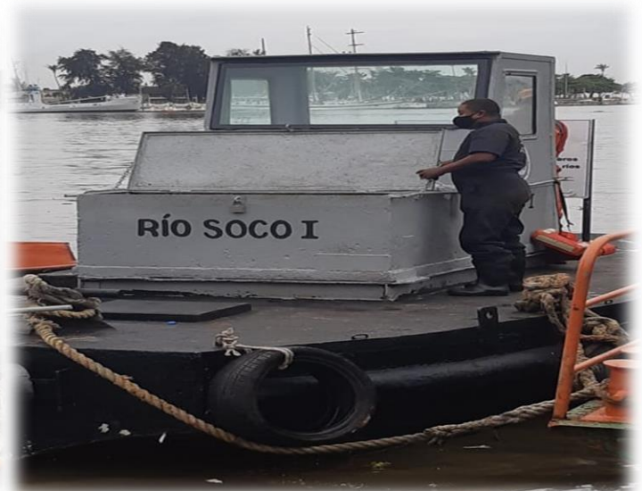
Restauración Remolcador Río Soco (Patico)