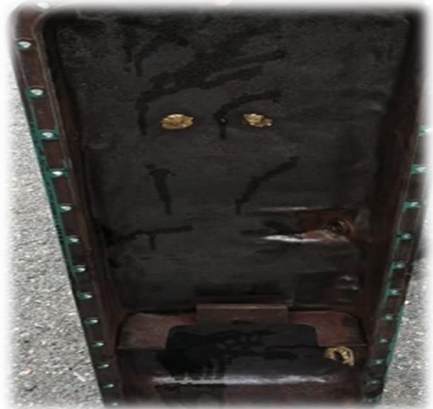
Acondicionamiento del Cran.